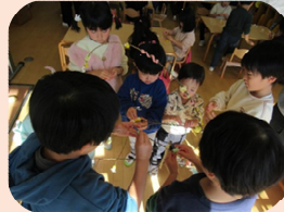
※「はっぴーちょいす（異年齢交流）」の様子