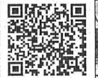
モバイル山岳情報