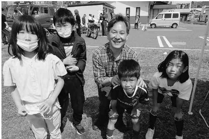
▲子どもたちといっしょにまちづくりに挑戦します! (4月6日ひな市)