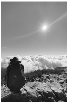
▲南アルプス 白峰三山稜線にて

の恩恵に浴する生活は、きつと快いものになるだろうと大いに期待しています。しかし「山」は心地よさを提供してくれるものである一方で、近隣の地域社会に害をなす動物たちの住処でもありません。必要以上に増やしてしまい、皆さまの田畑や家を荒らすその動物たちは、反比例して減り続ける地元猟師さんだけでは対処しきれないという現状を耳にしました。そこで「山」の酸いも甘いも全てを享受して、特に負に作用する面を分不相応ながらも整えたいと思っています。地域おこし協力隊としての活動内容は有害鳥獣対策が主となりますが、それ以外の分野でも広く知識を吸収し、人として強く、また大きく成長していきたいと思っておりますので、これから何卒よろしくお願ひします。