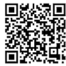
総務省消防庁 「Q助」案内サイト

もし救急車を呼ぶことに迷いがあつたら… 総務省消防庁から出されている「全国版救急受診アプリ」愛称「Q助」というアプリを使ってみてください！