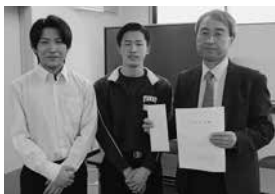
▲卒業生からの寄付

町への寄付金は、卒業生よりお世話になった交流センターかえで役立つものを購入して欲しいとの希望により、わくわくキッズルームやイベント開催時に使う物品を購入させて頂きました。今後中学生が地域のことを思って活動した志に感謝しながら有効に利用させていただきまます。