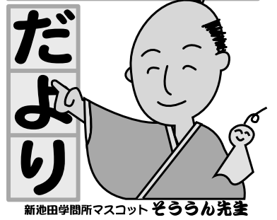
新池田学問所マスコット そろろん先主