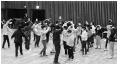
▲体を動かしながら交流

今年池田町が会場となり、小中学生ら80人が参加し、活動発表や少年の主張長野県大会優良賞受賞作文の発表や交流会を行いました。来年度は松川村で行う予定です。