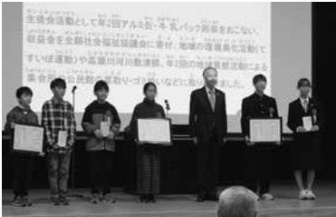
▲日ごろの活動が表彰されました