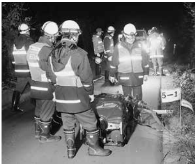
【問い合わせ先】 総務課危機管理対策室 Tel(62)3131

消防秋季訓練において初の夜間訓練を実施し、火災への備えを行いました。 町消防団は11月15日の午後8時から、豊町く内鎌の高瀬川堤防道路周辺で、秋の火災予防運動に伴う秋季訓練を行いました。 今回は暗い中でいち早く安全に効率よく送水をするのが課題となると共に、この時期は農業用水が減るため少ない水を有効に使用することも重要です。 今回は、延長約2・6kmを消防車両10台で繋ぎ、高低差は南方へ約30m以上下った先への放水となりました。これまでには主に低いところから高いところへの放水が多い訓練でしたが、昨年と今年は逆勾配での訓練です。このため、通常はホースやポンプに負荷がかかり、故障の原因になりかねないだけでなく、2年前までは水を抜きながら減圧する方法でしたが、今回は装着するだけで減圧できるダイレクトバルブも部