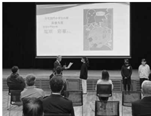
【問い合わせ先】住民課 環境係 Tel (62) 2203