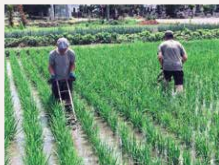
「田ぐるま」を初体験 (7月13日 移住定住通信 19から)

池田町ホームページ ( http://www.ikedamachi.net/ ) ホーム > 池田町の魅力 > 移住定住