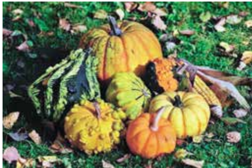
色や形もいろいろ

日本では、粘質で煮物向きの日本カボチャが古くから食べられていますが、現在では、粉質で甘い西洋種の栗カボチャ系が主流です。他の種類では、ズッキーニに代表されるペポカボチャがあります。