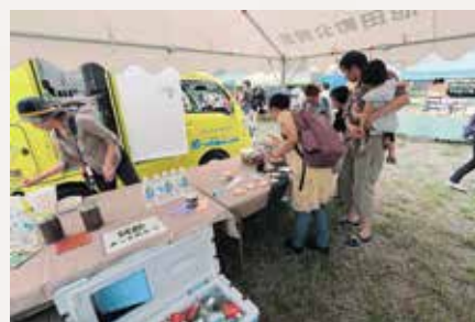
秋田県藤里町の特別出店