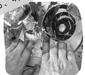
WS みちくささん 『りんごのハーバルハンドバス』 『桜のハーバルアートフレーム』