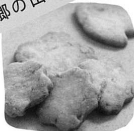
ぶんがさん 『桜クッキー』