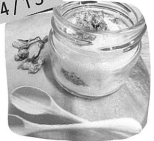
WS 夢農場 『桜のバスソルト』