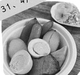
桜チップ de 燻製