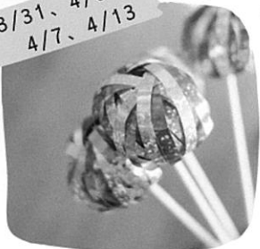
WS コロリートさん 『くるりんきらりん』