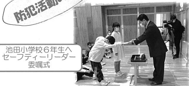
池田小学校6年生へ セーフティリーダー 委嘱式