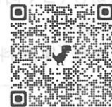
お申し込み用 QR コード