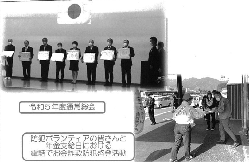
令和5年度通常総会