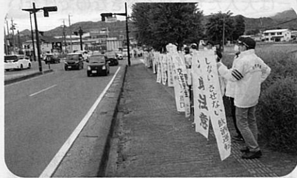
「春の全国交通安全運動」の活動の一環として県道長野真田線において街頭指導を実施した。(長野南・松代)