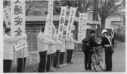
「信州さくら満開こども交通安全週間」の活動の一環として管内の高校において自転車ヘルメットの着用指導を実施した。(須高)