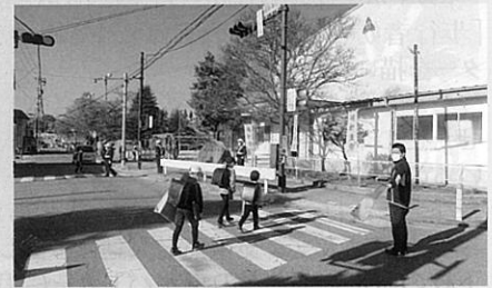
「信州さくら満開こども交通安全週間」の活動の一環として児童に対して交通安全を呼びかけた。(飯伊)