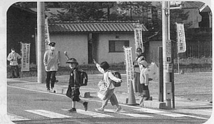
「春の全国交通安全運動」の活動の一環として、通学児童に対し道路の安全な横断方法等について指導を実施した。(池田松川)