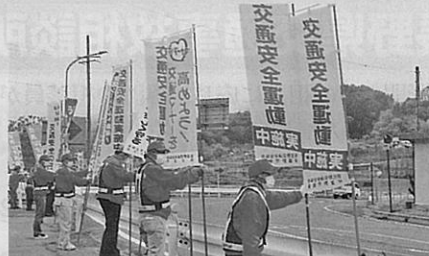
「春の全国交通安全運動」の活動の一環として筑北村の国道403号において街頭指導を実施した。(安曇野)