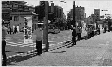
「春の全国交通安全運動」の活動の一環として国道19号において街頭指導を実施した。(長野)

交通安全協会は、交通事故をなくすため、様々な活動を行っています。活動の一例を紹介します。