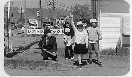
「信州さくら満開こども交通安全週間」において児童に対して正しい横断方法について指導した。(川西)