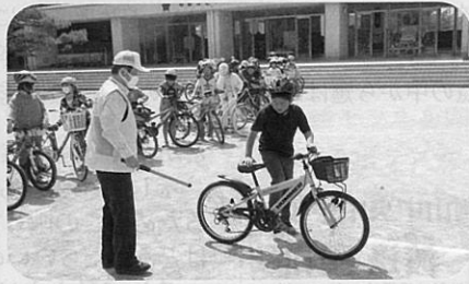
管内の小学校の交通安全教室において自転車乗りの安全な乗り方について指導を実施した。(中高)