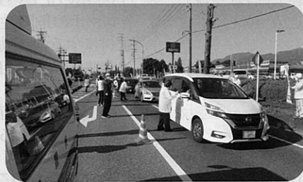
「春の全国交通安全運動」の活動の一環として国道153号伊南バイパスにおいて街頭指導を実施した。(伊南)