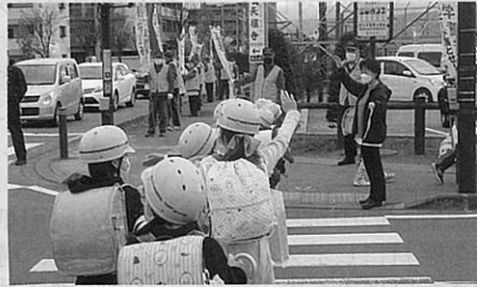
「信州さくら満開こども交通安全週間」の活動の一環として児童に対して交通安全を呼びかけた。(佐久)