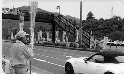
国道19号において隣接する岐阜県中津川警察署及び同交通安全協会と協同による交通指導所を開設し、街頭指導を実施した。(木曽)