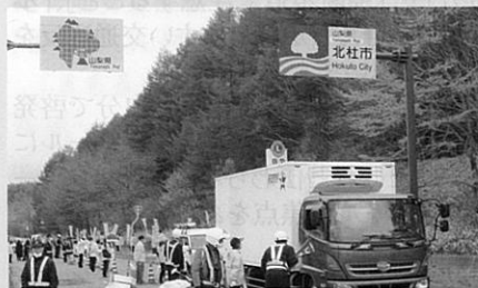
国道141号において隣接する山梨県北杜警察署及び同交通安全協会と協同による交通指導所を開設し、街頭指導を実施した。(南佐久)