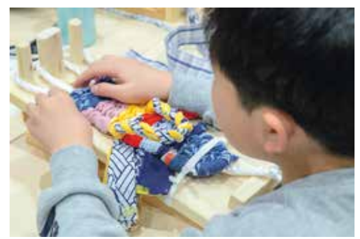
世界に一つだけのマイぞうり！

2月8日にふるさとチャレンジ塾8回目の講座「布ぞうり作りにチャレンジ！」を交流センターで開催しました。今年度最後となるふるさとチャレンジ塾は、松川村研友会ぞうり部の皆さんを講師にお招きし、一人一足オリジナルのぞうりを作りました。配色を考えながら布を選び、自分の足に合うようにサイズを調整し、講師の皆さんに教えてもらいながら、専用の編み台を使って少しずつ編み込みました。出来上がりを早速履いてみると、素足に布の柔らかさがとても心地よく子どもたちから「気持ちいい！」という声が聞かれました。