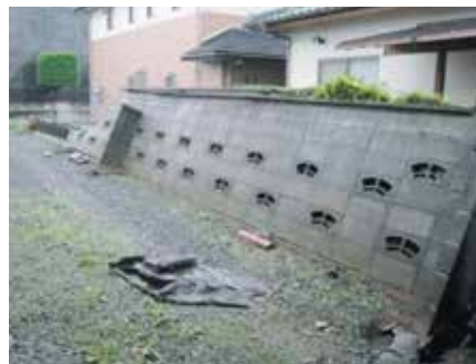
倒壊したブロック塀

除却工事費と除却する塀の長さ×1万円の金額を比べ、低い方の金額の1/2以内で最大10万円