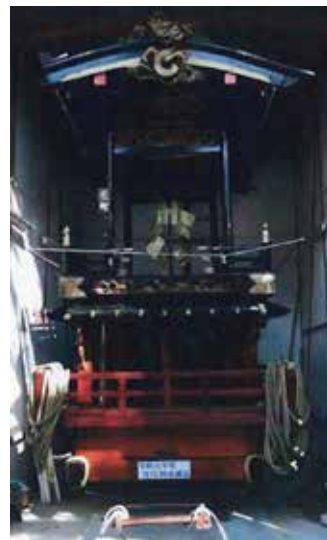
修理が済んだ東町舞台

今年度、この事業を活用し、東町舞台の車輪修理を行いました。今後も、地域に根差したコミュニティ活動の活性化が期待されます。