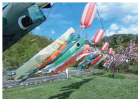
ワークショップで作ったミニ鯉のぼりがズラリ(昨年の様子)