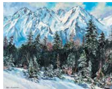
「冬の晴れ間」江村真一

日本山岳画協会OBの作品を含め、総展示数85点。この規模の展覧会は日本山岳画協会史上初であり、かつ、本邦でこれまで開催された山の絵の展覧会の中でも最大級の規模となりますので、お見逃しなく。