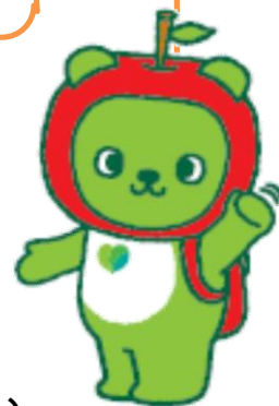
長野県PRキャラクター 「アルクマ」 ©長野県アルクマ