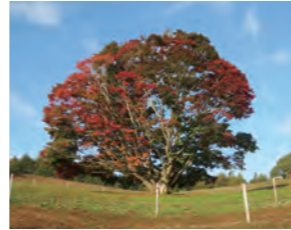
大峰高原の七色大カエデ

愛称「かえで」には、様々な年代の人々を惹きつける池田町のシンボル「大峰高原七色大カエデ」のように、交流センターが子どもからお年寄りまで大勢集い交流し、楽しみ癒される空間となるよう願いが込められています。