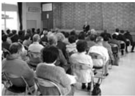
熱心に話を聞く参加者の皆さん

「地域の人や友人に支えられ、野山を駆け巡った少年時代の経験が、その後の生活に非常に役に立った。子どもは自然と闘争しなければならず、その時の数々の経験が大人になってからの勇気につながり、精神的な安定も生む」と熱く語っていました。